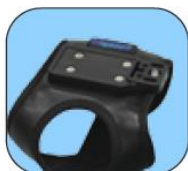
Fixer avec le Velcro